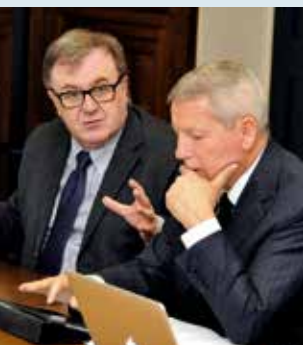
L'assessore Gilmozzi e il Commissario del Governo Fabris nella riunione di fondazione dell'Osservatorio.