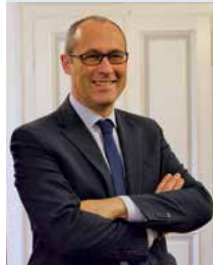
Ugo Rossi Presidente delle Provincia autonoma di Trento

Besonderes Augenmerk wird auf die Kommunikation mit den betroffenen Gebieten gelegt. Hierzu soll insbesondere mit der für diesen Zweck vorgesehenen und demnächst eröffneten Beobachtungsstelle sowie mit der Brenner Korridor Plattform und dem Forum des Scan-Med-Korridors zusammengearbeitet werden. Ziel ist es, den Schienenverkehr wettbewerbsfähiger zu machen und bereits kurz- und mittelfristig einen Beitrag zur Reduzierung der Emissionen zu leisten.