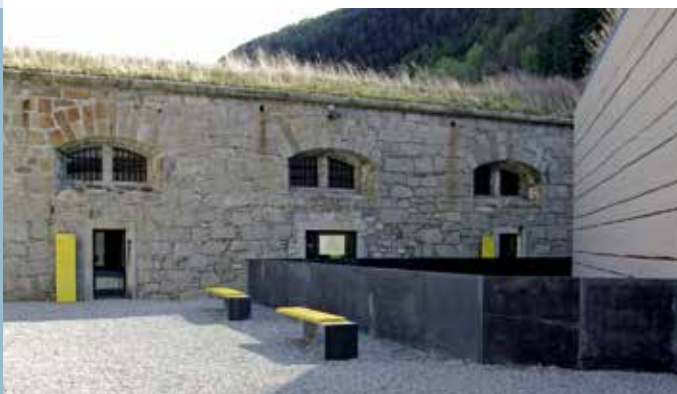
Sede della segreteria nel Forte di Fortezza

Wie ein roter Faden zieht sich die Informations- und Öffentlichkeitsarbeit durch, wobei das Ausarbeiten von Broschüren und spezifischem Informationsmaterial für Tagungen und Konferenzen immer prioritäres Ziel war. Die AGB versteht sich als unterstützende Beobachterin des Ausbaus der Brennerbahn und als Verbindungsglied zur Bevölkerung, damit diese informiert wird und mitentscheiden kann. Dafür wurde im Laufe der Jahre eine Reihe von Maßnahmen getroffen. Seit 2004 erscheint „Transfer, Periodikum zur Förderung der Entwicklung der Eisenbahnachse München-Verona“. 2009 wurde zudem der Informationsfilm „Die neue Brennerbahn mit Basistunnel“ in Auftrag gegeben. Innovativ war im Jahr 1999 der Aufbau der Website, welche heute zu den wichtigsten Informationskanälen zählt. Die Einrichtung eines Ständigen Sekretariates der AGB wurde im Dezember 2010 beschlossen und umgesetzt. Es soll als Service-Stelle für alle Belange der Aktionsgemeinschaft Brennerbahn dienen und die interne und externe Kommunikation verbessern. Das Ständige Sekretariat ist bei der Beobachtungsstelle des Brenner Basistunnels angesiedelt und mit dieser im Jahre 2015 in die Franzensfeste übersiedelt (Transfer 01/11, S. 15).