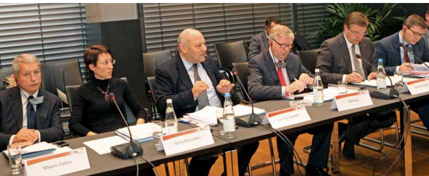
Conferenza dei presidenti della CAB a Bolzano sotto la direzione del presidente emerito Luis Durnwalder.