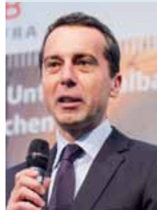
CEO di ÖBB Christian Kern alla cerimonia di Radfeld

Insgesamt neun Jahre hat der Bau der neuen Unterinntalbahn in Anspruch genommen. Am 26. November 2012 war es schließlich soweit, die Ingenieure der ÖBB haben ihr Ziel erreicht. Gemeinsam mit mehr als 1.000 Anrainern und Projektbeteiligten sind sie mit zwei Zuggarnituren zum Fertigstellungsfestakt nach Radfeld gereist. Die Bedeutung der neuen Unterinntalbahn würdigte anschließend auch der ÖBB-Vorstandsvorsitzende Christian Kern: „Mit den neuen Hochleistungstrecken hängt die ÖBB erstmalig das Auto ab und wird zwischen Wien und Innsbruck konkurrenzfähig mit dem Flugverkehr. Kunden, Anrainer und die Tiroler Wirtschaft werden vom Ausbau maßgeblich profitieren.“