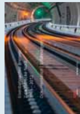
Eisenbahnachse Brenner, Zulaufstrecke Nord, 1996 – 2012 Dokumentation und Erfahrungen. 256 Seiten, Haymon Verlag, Innsbruck 2012

→ Aus Anlass der Inbetriebnahme der neuen Hochleistungstrecke im Unterinntal wurde ein prächtiger Bildband aufgelegt. Hunderte spektakuläre Fotos zu den Baumaßnahmen machen die nun abgeschlossenen Arbeiten auch für Laien verständlich. Dutzende Luftbilder geben Einblick in den Trassenverlauf. Ergänzt werden die Bilder durch Interviews, die zeigen, dass auch hinter der modernsten Technik Menschen stehen.