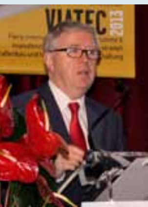
Pat Cox, coordinatore UE per il TEN-T 1, durante il suo intervento