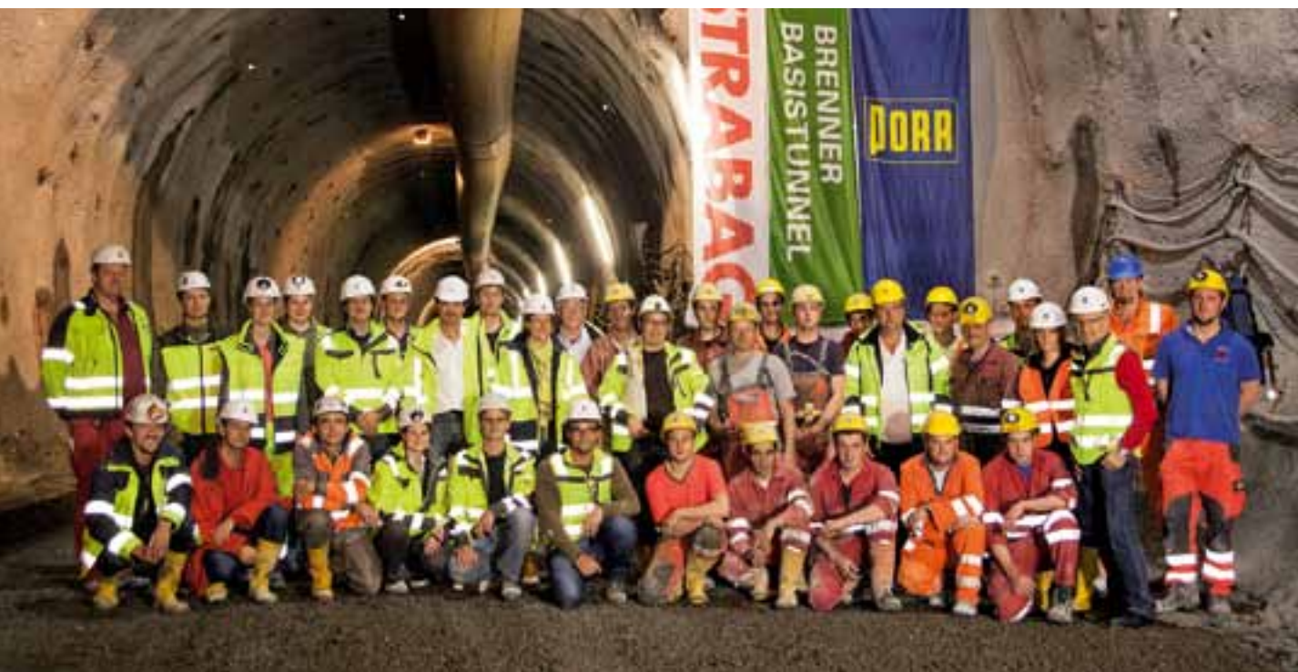
Rottura del diaframma ad Ahrental: Il team dell'ATI "Erkundungsstollen Brenner Nord"

In Österreich laufen die Vortriebe derzeit an zwei Baustellen. Zum Einen ist dies der Zufahrtstunnel Ampass, der eine Länge von 1.100 Metern erreicht hat, wodurch bereits zwei Drittel gebaut sind; zum Anderen entsteht unterhalb der Ortschaft Patsch bei Innsbruck der Erkundungsstollen Richtung Brenner, der mittlerweile eine Länge von 4,4 Km erreicht hat. Im Oktober 2012 traf der seitliche Zufahrtstunnel in Ahrental (2,4 Km) mit dem Erkundungsstollen aus Innsbruck zusammen. Dies war der erste Durchbruch auf österreichischer Seite.