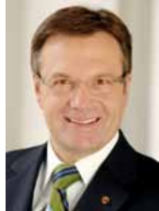
Günther Platter Presidente del LandTirolo

Neben den Interessen der Länder stehen vor allem auch die Anliegen der Anrainer im Vordergrund, denn der Personen- und Güterverkehr und seine Auswirkungen stellen eine der größten Herausforderungen im Alpenraum dar und verlangen einen überregionalen Ansatz und intensive Zusammenarbeit.